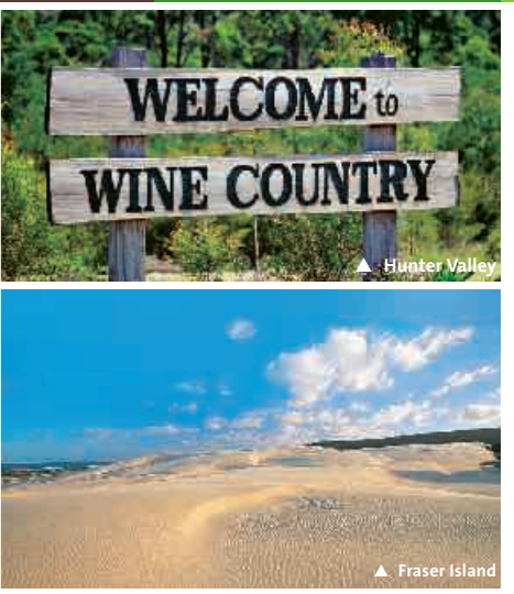
▲ Hunter Valley

Unterkunft: All Seasons Magnetic Island **** ●● 18. Tag: Magnetic i. – Atherton Tablelands Zurück auf dem Festland geht die Fahrt auf dem Bruce Highway nach Innisfail, lohnenswert ist unterwegs der Abstecher nach Mission Beach. Durch das Johnstone River Valley mit seinem dichten Regenwald erreichen Sie die Atherton Tablelands mit ihrem angenehmen kühlen Klima. Tageskilometer: ca. 377 km, ca. 4 Std. Unterkunft: Atherton Blue Gum **** ●● 19. Tag: Atherton Tablelands Die Seen der Atherton Tablelands und den ungewöhnlichen „Curtain Fig Tree“ sehen Sie auf der Fahrt durch die Atherton Tablelands ebenso die Millaa Millaa Wasserfälle. Unterwegs lohnt die ein und andere Wanderung oder ein erfrischendes Bad an einem der zahlreichen Badeplätze. Unterkunft: Atherton Blue Gum **** ●● 20. Tag: Atherton Tablelands – Port Douglas Auf dem Kennedy Highway geht die Etappe zunächst nach Mareeba und weiter in den beliebten Ferienort Port Douglas. Tageskilometer: ca. 118 km, ca. 1,5 Std. Unterkunft: Bay Villas Resort ***