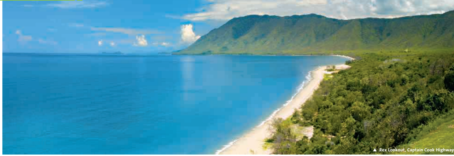
▲ Rex Lookout, Captain Cook Highway

Hinweis zur Buchung mit internationalen Flügen Dauer des Landprogramms: 25 Tage/24 Nächte; Dauer inklusive Langstreckenflüge (laut System) je nach Fluggesellschaft ca. 27-28 Tage.