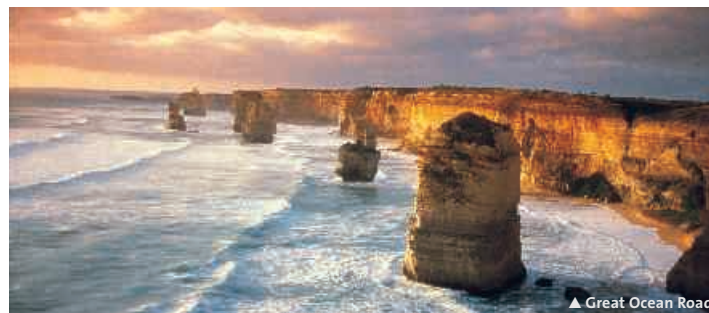
▲ Great Ocean Road

5 Tage/4 Nächte ab Melbourne bis Adelaide oder umgekehrt