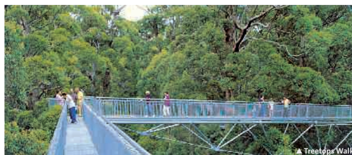
▲ Treetops Walk