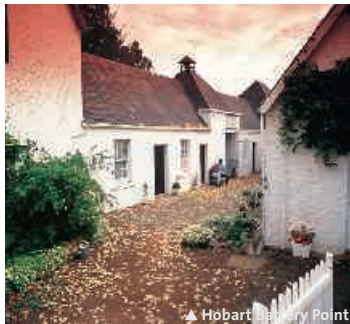
▲ Hobart bei Strahan Point