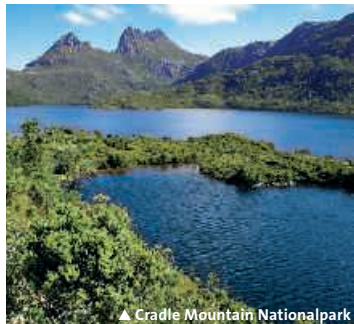
▲ Cradle Mountain Nationalpark