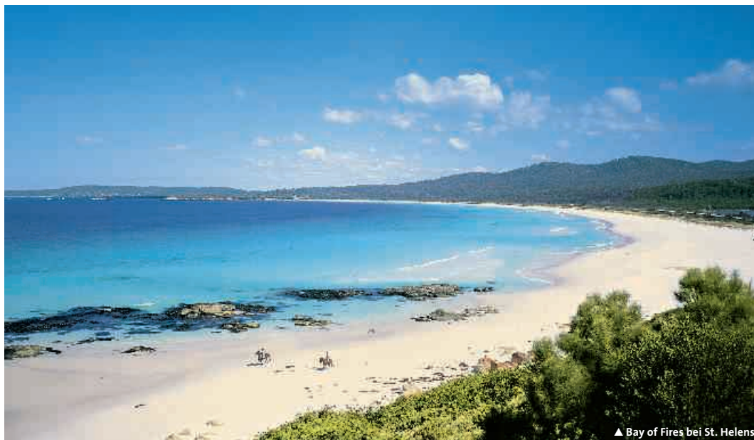
▲ Bay of Fires bei St. Helens