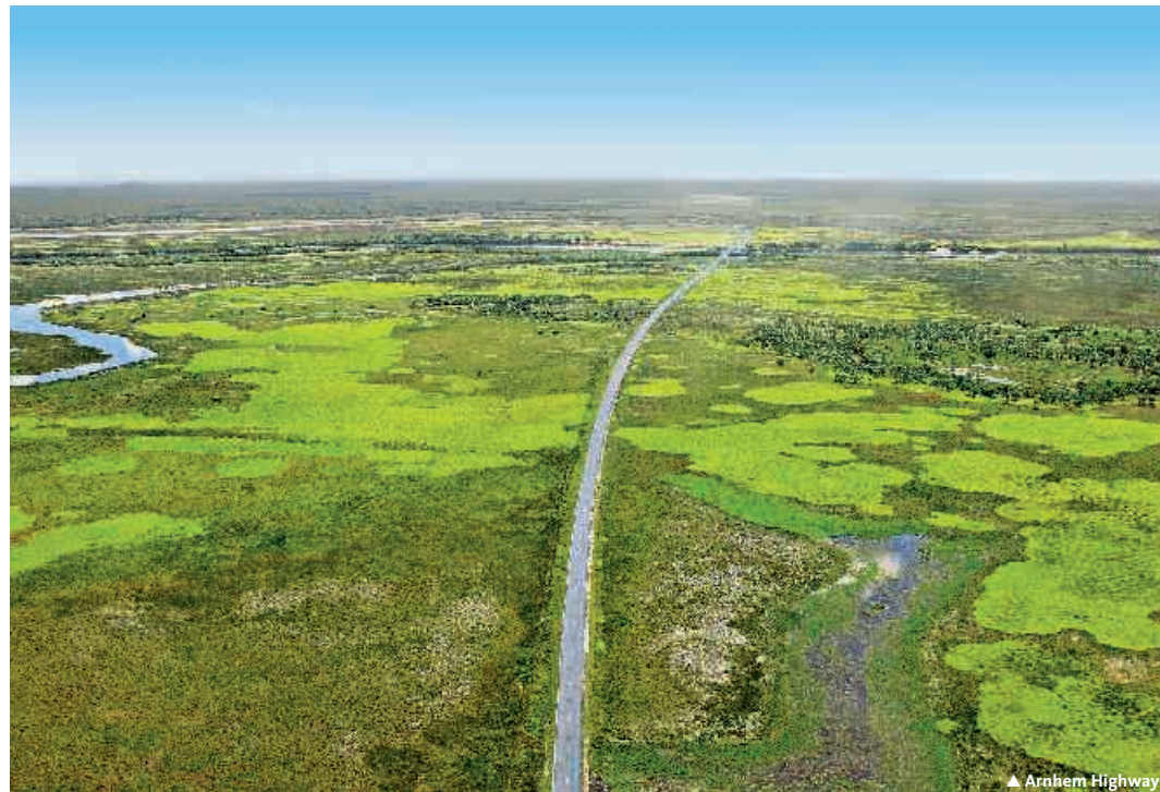
▲ Arnhem Highway

8 Tage/7 Nächte ab Darwin bis Ayers Rock