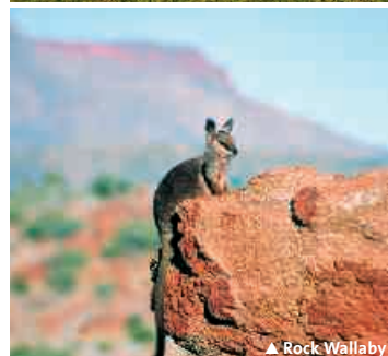
▲ Rock Wallaby