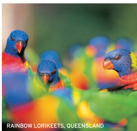
RAINBOW LORIKEETS, QUEENSLAND