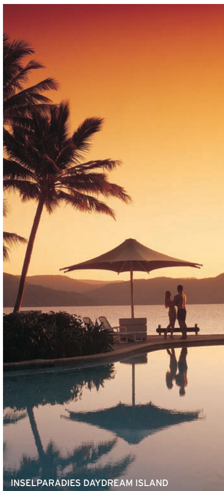
INSELPARADIES DAYDREAM ISLAND