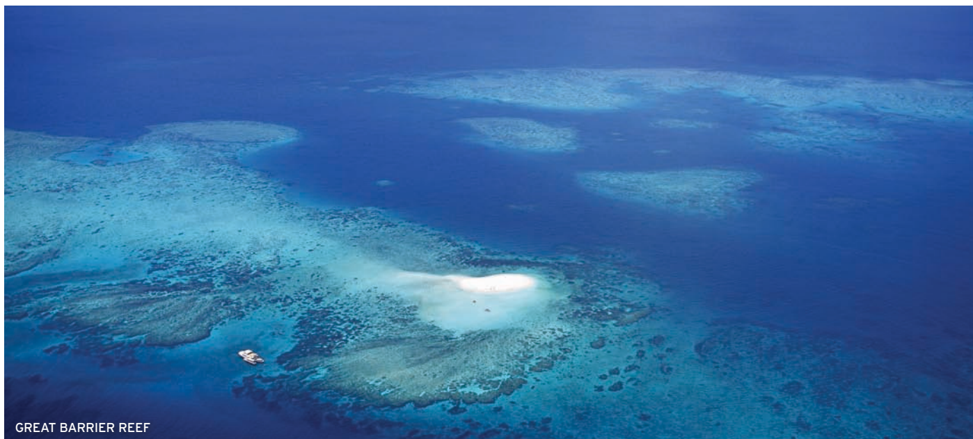
GREAT BARRIER REEF