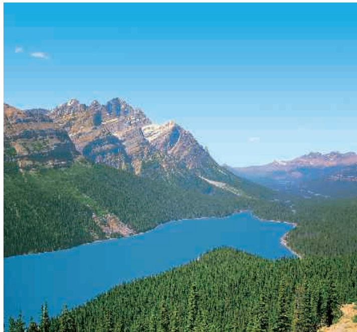
▲ Peyto Lake