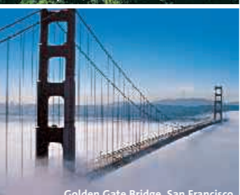
Golden Gate Bridge, San Francisco