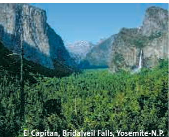
El Capitan, Bridalveil Falls, Yosemite-N.P.

14. Tag: Death Valley Nationalpark – Sequoia Nationalpark Über Bakersfield geht die Fahrt nach Visalia, das Tor zum Sequoia Nationalpark mit seinen gleichnamigen Mammutbäumen. Tageskilometer: ca. 283 km (Standard), ca. 510 km (Standard Plus) Hotel: Best Western Town & Country Lodge ●●● (Standard, F), Visalia Marriott ●●● (Standard Plus, S. 332) 15. Tag: Sequoia N.P. – Yosemite N.P. Weiterfahrt zu einem der beliebtesten Nationalparks Amerikas, dem Yosemite mit beeindruckenden Granitfelsen und Wasserfällen. Tageskilometer: ca. 300 km Hotel: Clarion Hotel Modesto ●● (Standard, F), Shilo Inns Suites Oakhurst ●●● (Standard Plus, F) 16. Tag: Yosemite Nationalpark – San Francisco Durch ehemaliges Goldgräberland geht es weiter nach San Francisco. Viele Sehenswürdigkeiten wie Fishermans Wharf und die faszinierende Golden Gate Brücke warten darauf, von Ihnen entdeckt zu werden. Tageskilometer: ca. 340 km Hotel: Embassy Hotel ●● (Standard, F, S. 299), Hotel Whitcomb ●●● (Standard Plus, S. 302), 2 Übernachtungen 17. Tag: San Francisco Genießen Sie heute einen ganzen Tag in dieser faszinierenden Metropole.